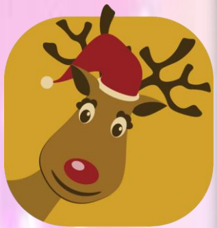
カジキ画伯のイラストコーナー